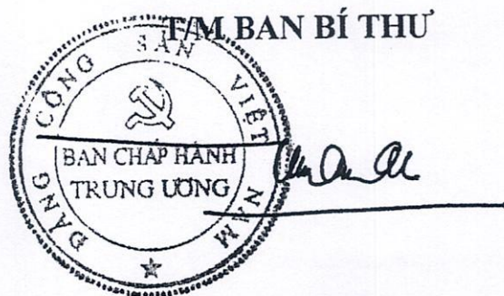
Trương Thị Mai